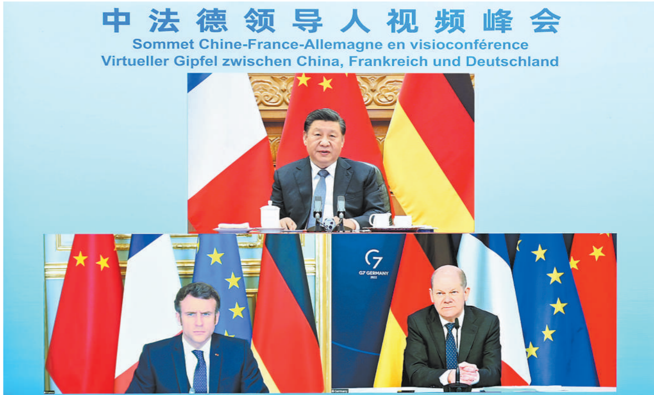
3月8日下午,国家主席习近平在北京同法国总统马克龙、德国总理朔尔茨举行视频峰会。

新华社北京3月8日电 国家主席习近平3月8日下午在北京同法国总统马克龙、德国总理朔尔茨举行视频峰会。