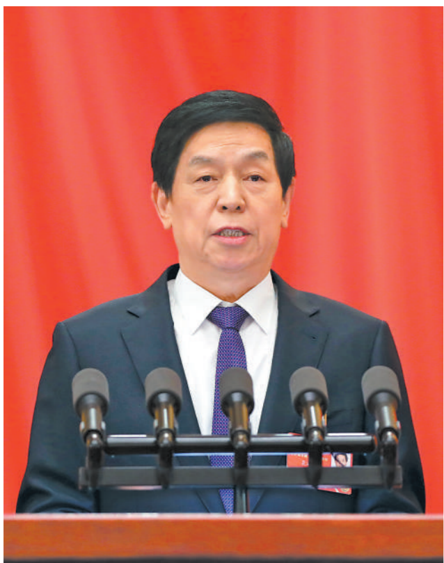
3月8日,十三届全国人大五次会议在北京人民大会堂举行第二次全体会议。受全国人大常委会委托,栗战书委员长向大会报告全国人大常委会工作。

习近平李克强汪洋王沪宁赵乐际韩正王岐山等出席 栗战书作全国人大常委会工作报告 听取和审议最高人民法院工作报告和最高人民检察院工作报告