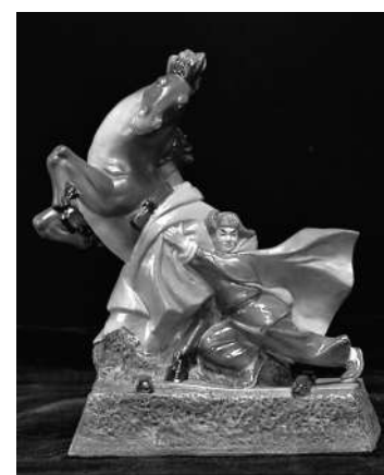
英雄战士欧阳海(瓷雕) 刘远长作

用赤诚点燃一颗火苗 红星在前额闪耀 用生命照亮希望 用希望燃烧生命 那岁月,你还记得吗