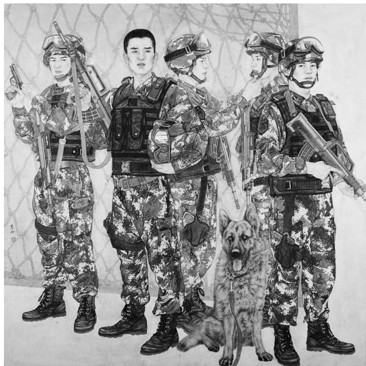
兵样(中国画) 韦伶作

走进展厅,一幅幅以个体或群像、组图等方式描绘宏大历史事件的作品扑面而来,给人以心灵的震撼。徐里的油画《启航》运用强烈冷暖色彩对比,加强视觉冲击力和艺术张力,画面生动自然,富有意境;邵亚川的油画《窑洞中的灯光》用写实的绘画手法,刻画了毛泽东、朱德等老一辈革命家在延安窑洞集体学习马列著作的瞬间。那盏微弱的灯光,喻示真理之光、信仰之光,照亮了中国革命前行的道路;《华北军演》则聚焦新中国成立以来当时我军规模最大的—次军事实战化演习。画面中铁甲云集、战机轰鸣,场景惊心动魄;苗再新的中国画《百团大战》用笔厚重、作者突破常规的构图方式,以组图形式,营造了一个气势恢宏的战争场面,并通过细致入微的人物刻画,从多个角度反映了战斗的激烈与残酷,凸显了我军大无畏的英雄气概,反映了在中国共产党的领导下,全民团结一心、同仇敌忾的民族精神;陈树东的油画《星火》以写实兼写意的创作手法,描绘了50多位中国共产党早期领导者的历史人物群像。作者在现实主义的底色中借鉴雕塑艺术语言表现形式,使人物形象具有铜墙铁壁般的质感,展现了建党初期中华大地星火初燃之势,描绘了中国共产党人坚定的信仰和光辉形象。此外,中国画《狼牙山五壮士》《更喜岷山千里雪》,油画《四渡赤水》《会宁大会师》,雕塑《红