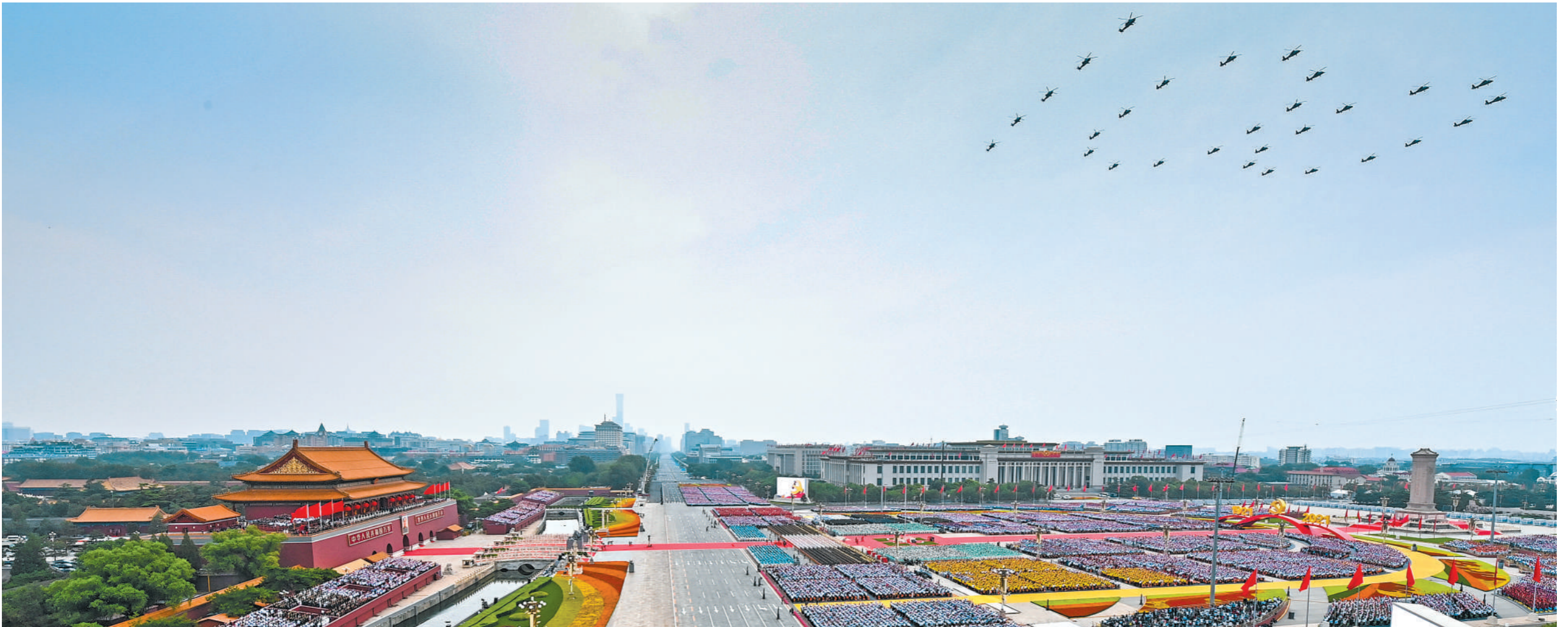
七月一日，庆祝中国共产党成立一百周年大会在北京天安门广场隆重举行。

神州大地欣欣向荣、气象万千，首都北京花团锦簇、旗帜飘扬。在伟大的中国共产党领导下，近代以后久经磨难的中华民族迎来了从站起来、富起来到强起来的伟大飞跃。（下转第四版）