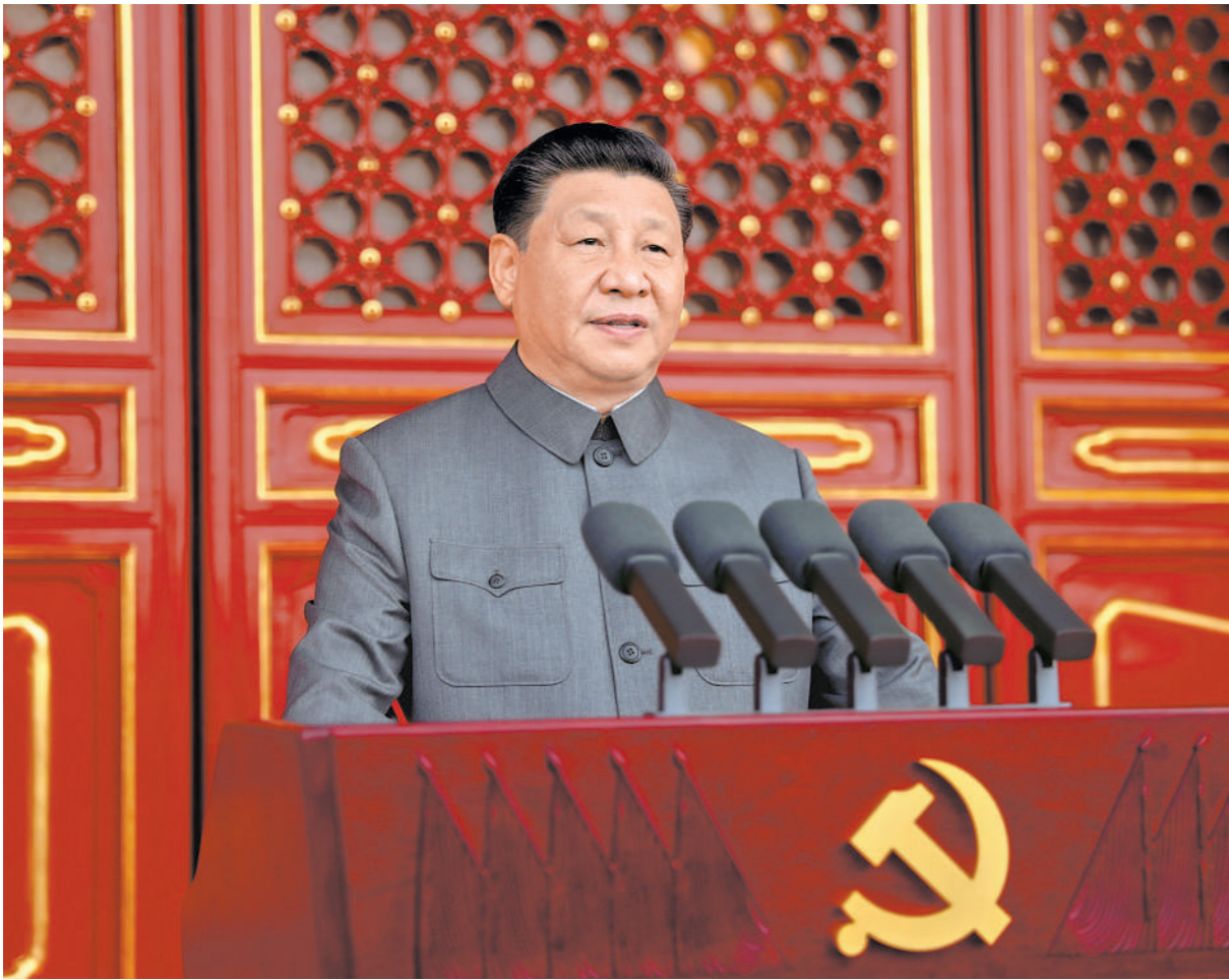
7月1日，庆祝中国共产党成立100周年大会在北京天安门广场隆重举行。中共中央总书记、国家主席、中央军委主席习近平发表重要讲话。