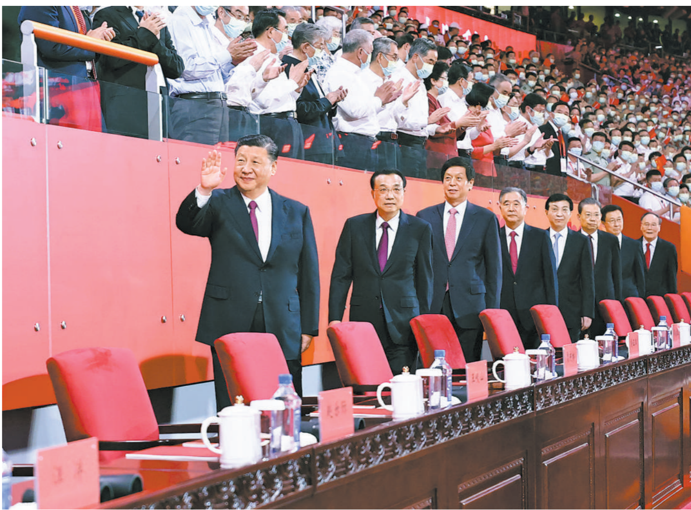
6月28日晚,庆祝中国共产党成立100周年文艺演出《伟大征程》在国家体育场盛大举行。习近平、李克强、栗战书、汪洋、王沪宁、赵乐际、韩正、王岐山等党和国家领导人,同约2万名观众一起观看演出。

新世界? 第二章“风雨无阻”以舞蹈《开国大典》开篇,回顾热火朝天的社会主义革命和建设年代。在震耳欲聋的炮声中,情景合唱与舞蹈《战旗美如画》呈现抗美援朝的激战场面,讴歌志愿军战士保家