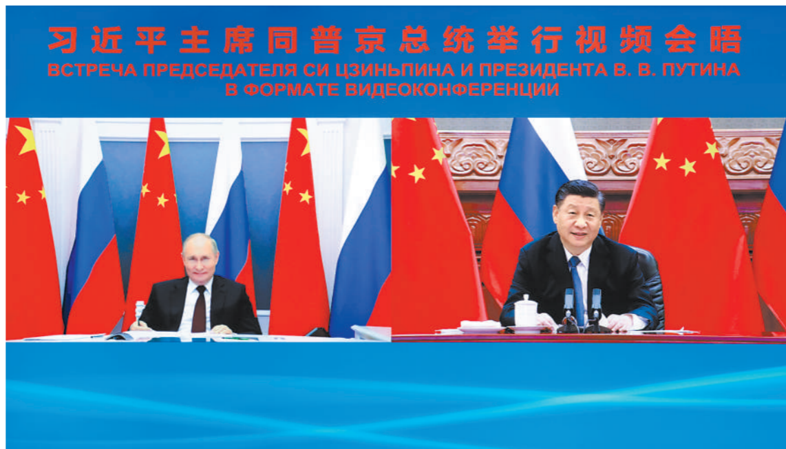
6月28日下午,国家主席习近平在北京同俄罗斯总统普京举行视频会晤。

新华社北京6月28日电 国家主席习近平28日下午在北京同俄罗斯总统普京举行视频会晤。两国元首宣布发表联合声明,正式决定《中俄睦邻友好合作条约》延期。普京热烈祝贺中国共产党成立100周年。