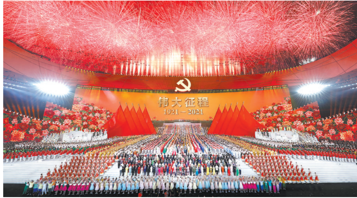
六月二十八日晚,庆祝中国共产党成立一百周年文艺演出《伟大征程》在国家体育场盛大举行。