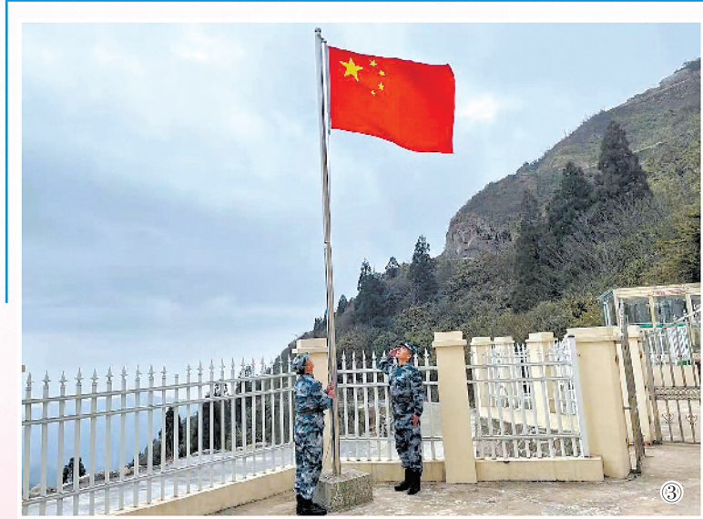
图③:国旗飘扬在东部战区空军某通信旅“前哨连”某海岛通信站。图④:驻守在某海岛通信站的官兵。