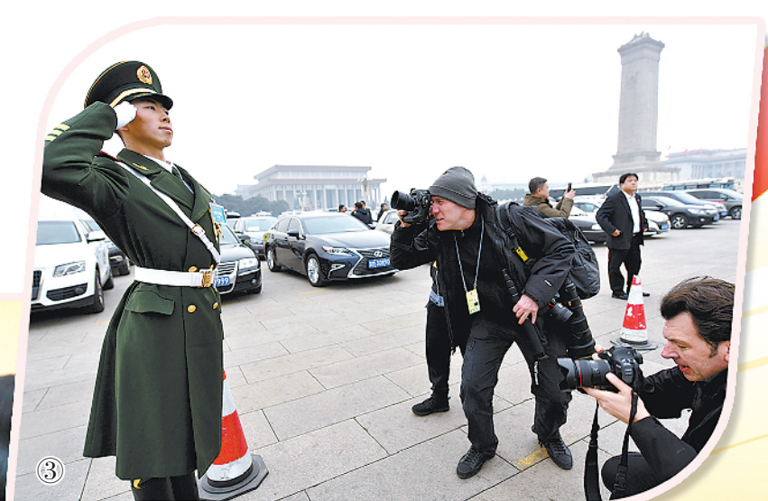
图①：军队政协委员在会议间隙交流。 图②：军队政协委员接受媒体采访。 图③：在天安门广场执勤的战士引起外国记者关注。